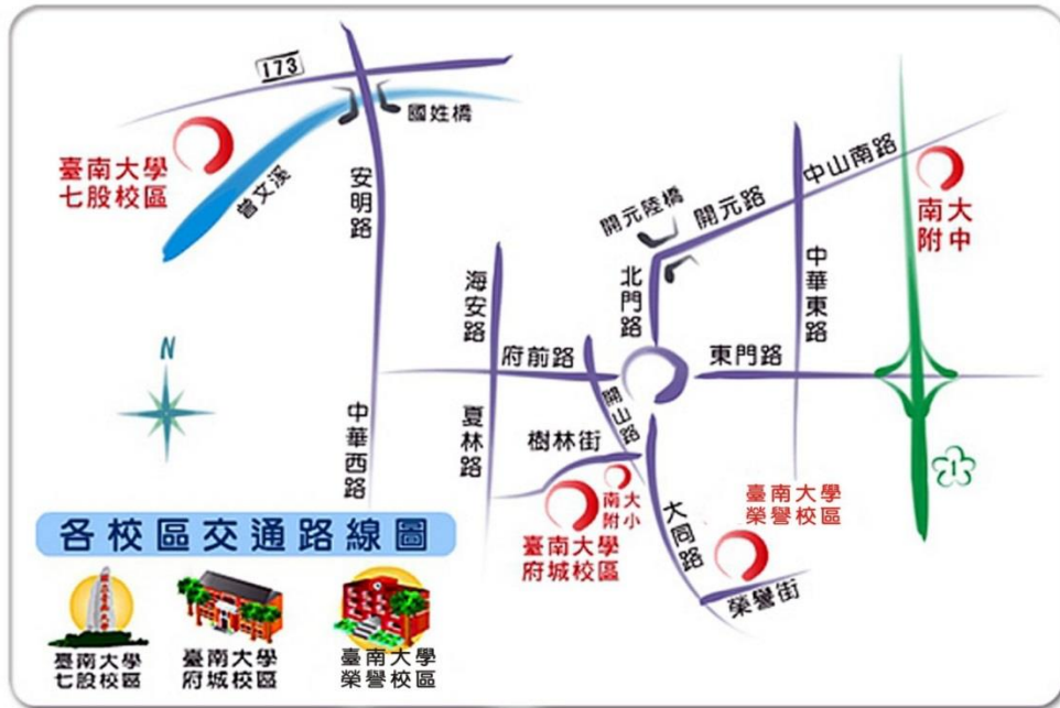
國立臺南大學 府城校區平面圖(正門) National University of Tainan Main Campus Map (Main Gate)