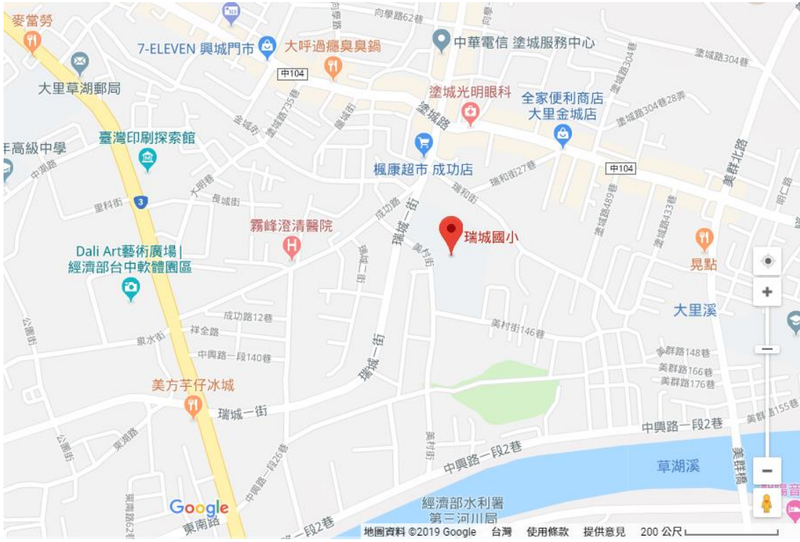
臺中市大里區瑞城國小鄰近台三線附近