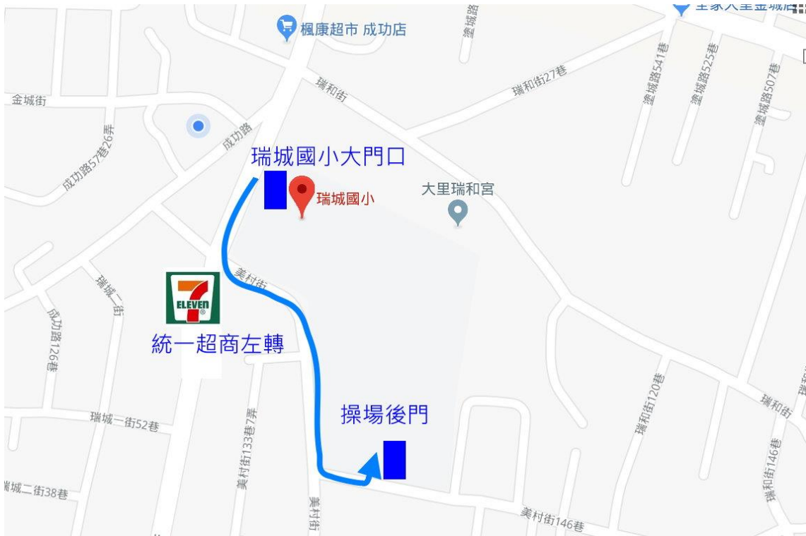
停車及上課地點近學校操場後門